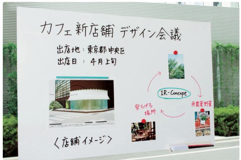
ガラス面にピタッと吸着

注：吸着ホワイトボードロールの裏面にはセパレーターがついています。剥がしてからご使用ください。