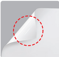
くりかえし貼って剥がせる吸着素材