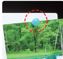
表面に磁石がつけられる