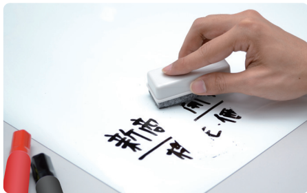
表面はホワイトボード