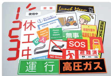
サイン系マグネットシート