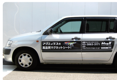
車両用マグネットシート使用例