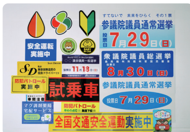
車両用マグネットシート