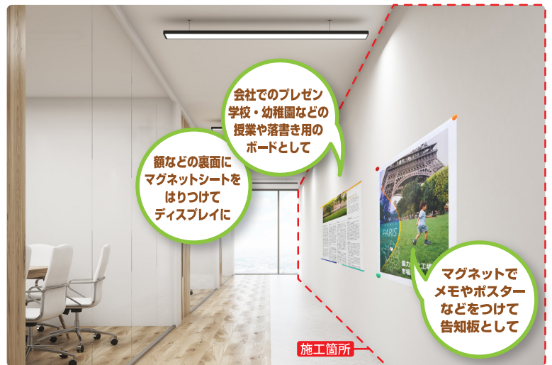
メタルフレックスシート施工イメージ