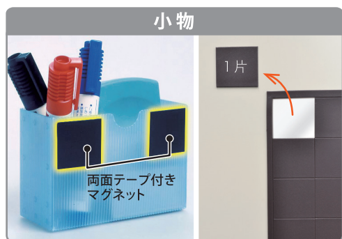
小物の裏に貼れば、ちょっとしたスペースにもピタッとつけられます