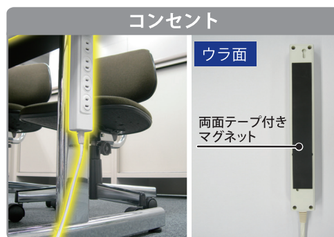
コンセントの裏に貼れば机の脚などにつけることができ、スペースを有効に使うことができます